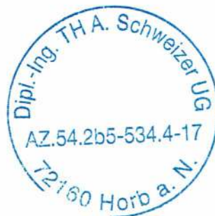
Dipl.-Ing. TH Arsen Schweizer UG

Diese Bescheinigung verlängert die Gültigkeit des vorausgegangenen Sachkundenachweises um sechs Jahre.